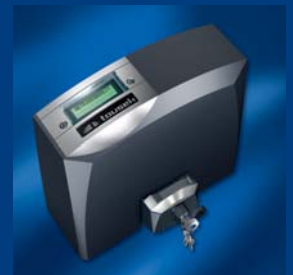
pohony posuvných bran tousek kompaktní a stabilní