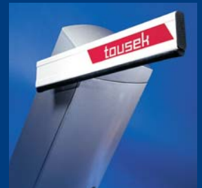
závorové systémy tousek robustní a tvarově dokonalé