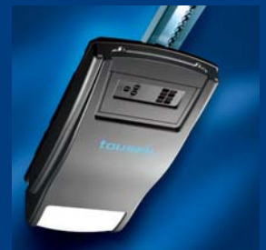
pohony garážových vrat tousek úsporné a rychlé