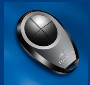
program dálkového ovládání tousek kompatibilní a bezpečný